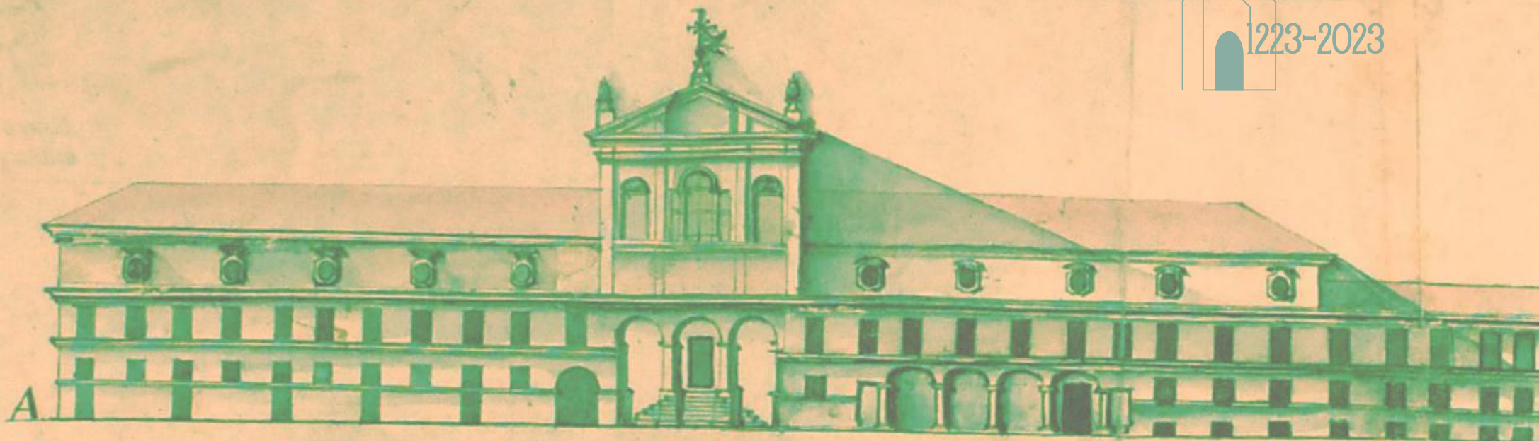
A. Prospetto della facciata verso la Contrada