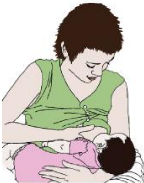
Fig. 1 Cradle Position