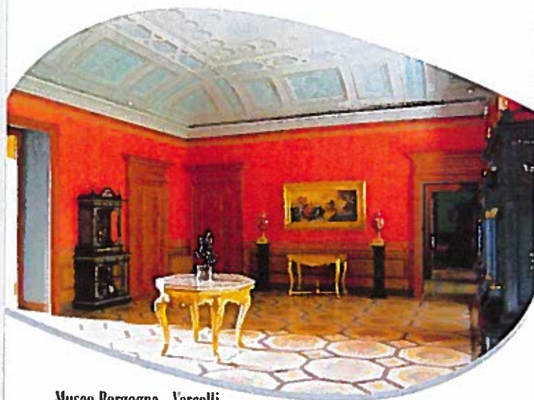
Museo Borgogna - Vercelli